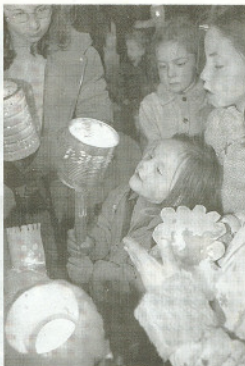
Niños con sus farolillos y calabazas. C.O.