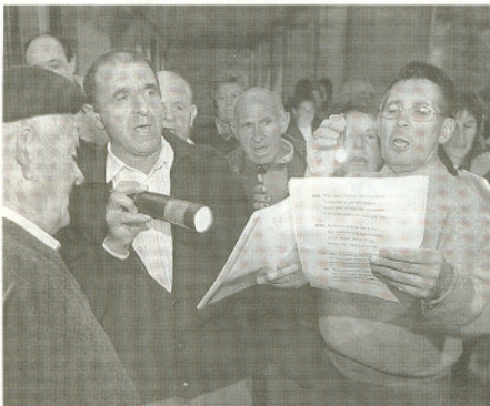
Los vecinos de Tajueco entonan el Cántico de las Ánimas. CONCHA ORTEGA